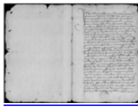
MS 1163-27P.5 - F.3

La résistance des conversos face à ces actions conduisit, en Aragon, à l'assassinat de l'inquisiteur de Saragosse, Pedro Arbuès, le 15 septembre 1485. Dès lors, entre 1486 et 1503, l'Inquisition aragonaise mit à mal l'emprise sociale et politique des conversos et pourchassa ces derniers, multiplia les autodafés, n'épargnant personne et anéantissant la classe dirigeante, y compris la noblesse, de Saragosse. Le Ms 1172-36 (Bordeaux) et le Ms 1163-27 (Bordeaux), portant respectivement sur le jugement de Petrum Sanchez et de Vidau de Duranso, témoignent de l'assassinat de l'inquisiteur Arbuès et de la volonté du Saint-Office d'en punir les auteurs et leurs collaborateurs.