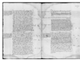
MS 1183-48P.81 - F.40

Dans tous les cas, relaxation et réconciliation s'accompagnaient de la confiscation des biens, comme cela apparaît dans les Ms 1171-35 et 1183-4 (Bordeaux). Dans certaines régions, on estime entre 25 et 40 % la proportion de relaxés en personnes et entre 30 et 60% celle des relaxés en effigie. Les réconciliés et ceux à qui était infligée une pénitence (Ms 1169-33, Bordeaux) pouvaient aller de 15 à 50%.