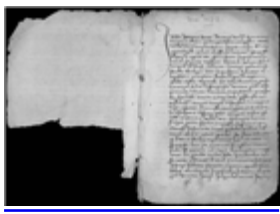
MS 1172-36P.1 - F.1