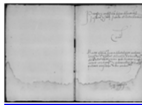
MS 1181-44P.25 - F.13

Mais, les manuscrits du catalogue témoignent de la réalité des pratiques inquisitoriales aragonaises propres à la fin du XVe siècle et au début du XVIe siècle. Ici, comme ailleurs dans la péninsule, cette période a vu l'activité des tribunaux se concentrer sur les « judaïsants », qui fournirent la presque totalité des accusés connus. Les actes d'accusation portaient sur leur hérésie, voire leur apostasie et la pratique secrète de rites judaïques. Seulement quelques accusations de mahométisme (Ms 1176-39, Bordeaux), quelques occurrences de sorcellerie (Ms 1181-44, Bordeaux), etc. apparaissent en marge.