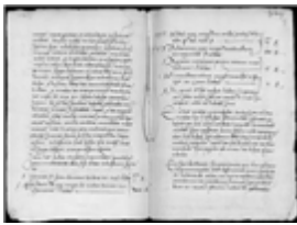
MS 1169-33P.141 - F.71

Dans tous les cas, relaxation et réconciliation s'accompagnaient de la confiscation des biens, comme cela apparaît dans les Ms 1171-35 et 1183-4 (Bordeaux). Dans certaines régions, on estime entre 25 et 40 % la proportion de relaxés en personnes et entre 30 et 60% celle des relaxés en effigie. Les réconciliés et ceux à qui était infligée une pénitence (Ms 1169-33, Bordeaux) pouvaient aller de 15 à 50%.