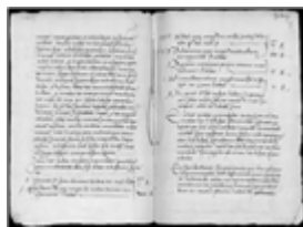
MS 1169-33P.141 - F.71

Dans tous les cas, relaxation et réconciliation s'accompagnaient de la confiscation des biens, comme cela apparaît dans les Ms 1171-35 et 1183-4 (Bordeaux). Dans certaines régions, on estime entre 25 et 40 % la proportion de relaxés en personnes et entre 30 et 60% celle des relaxés en effigie. Les réconciliés et ceux à qui était infligée une pénitence (Ms 1169-33, Bordeaux) pouvaient aller de 15 à 50%.