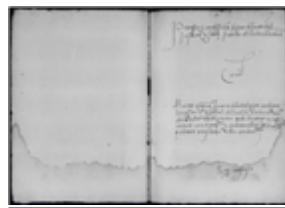
MS 1181-44P.25 - F.13

Mais, les manuscrits du catalogue témoignent de la réalité des pratiques inquisitoriales aragonaises propres à la fin du XVe siècle et au début du XVIe siècle. Ici, comme ailleurs dans la péninsule, cette période a vu l'activité des tribunaux se concentrer sur les « judaïsants », qui fournirent la presque totalité des accusés connus. Les actes d'accusation portaient sur leur hérésie, voire leur apostasie et la pratique secrète de rites judaïques. Seulement quelques accusations de mahométisme (Ms 1176-39, Bordeaux), quelques occurrences de sorcellerie (Ms 1181-44, Bordeaux), etc. apparaissent en marge.