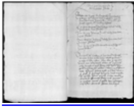
MS 1171-35P.115 - F.58

l'intensité ne se retrouvera heureusement plus après. Cruauté des peines d'abord, pour quatre types d'hérétiques : les pertinax (qui restent fermes dans leurs erreurs, refusant de se dénoncer en période de grâce ou arrêtés en dehors de cette période), les relaps (antérieurement réconciliés en période de grâce ou non et retombés dans l'hérésie), les suspects en fuite et les suspects défunts. Les pertinax et les relaps étaient « relaxés (brûlés) en personne ». Les deux autres catégories étaient « relaxées en effigie » (Ms 1177-40, Bordeaux). Pour les défunts, on récupérait le cadavre, quand c'était possible, et à défaut on brûlait son effigie, un mannequin.