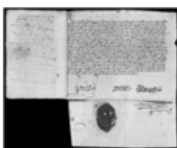
MS 1177-40P.71 - F.36

Quand les inquisiteurs arrivaient dans une ville, les délinquants disposaient d'une « période de grâce » pour se dénoncer spontanément et ainsi être absouts et « réconciliés », c'est-à-dire réintégrés dans le sein de l'Eglise, d'où leur hérésie les avait faits sortir. On se contentait alors de leur imposer quelque pénitence spirituelle. Passé ce délai, l'Inquisition œuvrait avec frénésie.