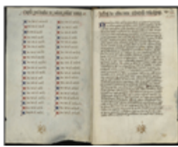
MS 0003P.329 - F.82

L'Inquisition avait été logiquement confiée aux dominicains par le pape, ordre spécialement créé pour ramener le Midi dans le sein de l'Eglise. Si sa présence était mal vécue par ceux qui les premiers devaient en redouter l'action, l'ensemble de la population témoignait plus largement d'une défiance particulière à l'encontre d'une institution symbolisant une occupation mal supportée. Malgré des soulèvements, émeutes et attentats contre l'Inquisition durant toute la seconde moitié du XIII e siècle, celle-ci finit par réduire à la clandestinité l'hérésie qui, vers 1300, disparut pratiquement des villes. On conserve toutefois dans notre catalogue, sous la plume de Bernard Gui, le souvenir du soulèvement des Albigeois contre les inquisiteurs et l'évêque Bernard de Castanet de 1301 à 1305. Conduits par le franciscain Bernard Délicieux, ils s'étaient alliés les représentants d'autres villes languedociennes engagées dans la même lutte. Ayant d'abord acquis le soutien royal, ils ne furent ensuite que partiellement entendus par le pape, qui orienta son action sur l'examen du comportement de l'évêque.