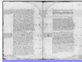
MS 1183-48P.81 - F.40

Dans tous les cas, relaxation et réconciliation s'accompagnaient de la confiscation des biens, comme cela apparaît dans les Ms 1171-35 et 1183-4 (Bordeaux). Dans certaines régions, on estime entre 25 et 40 % la proportion de relaxés en personnes et entre 30 et 60% celle des relaxés en effigie. Les réconciliés et ceux à qui était infligée une pénitence (Ms 1169-33, Bordeaux) pouvaient aller de 15 à 50%.