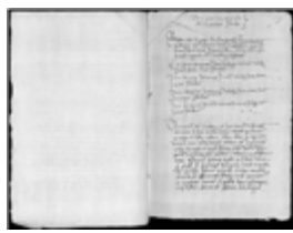
MS 1171-35P.115 - F.58

l'intensité ne se retrouvera heureusement plus après. Cruauté des peines d'abord, pour quatre types d'hérétiques : les pertinax (qui restent fermes dans leurs erreurs, refusant de se dénoncer en période de grâce ou arrêtés en dehors de cette période), les relaps (antérieurement réconciliés en période de grâce ou non et retombés dans l'hérésie), les suspects en fuite et les suspects défunts. Les pertinax et les relaps étaient « relaxés (brûlés) en personne ». Les deux autres catégories étaient « relaxées en effigie » (Ms 1177-40, Bordeaux). Pour les défunts, on récupérait le cadavre, quand c'était possible, et à défaut on brûlait son effigie, un mannequin.