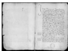
MS 1184-18P.3 - F.2

Les dernières exécutions eurent lieu à la fin du premier quart du XIV e siècle, époque à partir de laquelle l'Inquisition devint un rouage de l'administration ecclésiastique. Son tribunal se bureaucratisa. On mit en place des questionnaires stéréotypés pour l'interrogatoire des accusés, on multiplia les manuels, de plus en plus précis : à celui de Raymond Penafort (XIII e siècle) succèdent ceux de Bernard Gui (début du XIV e siècle) puis de Nicolas Eymerich (XV e siècle). Mais, son action déclina à propos de ses prérogatives fondamentales. Réduite à ne poursuivre que de petites hérésies, de petits groupes, l'Inquisition étendit sa juridiction à d'autres domaines, intégrant désormais le blasphème, la bigamie et la sorcellerie aux manifestations de l'hérésie.